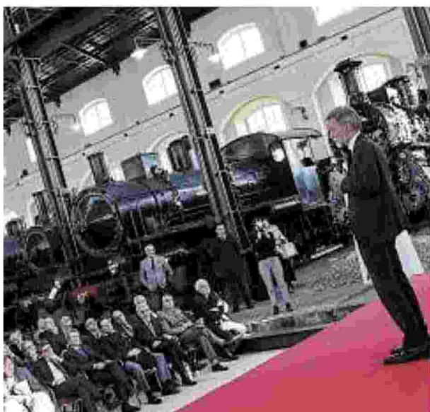
Il ritorno Un anno dopo nel museo di Pietrarsa il mondo del trasporto su ferro si è ritrovato assieme al ministro Delrio