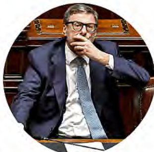
Il ministro dell'Economia, Giancarlo Giorgetti

Il differimento non richiede coperture, come spiegato in Parlamento dal sottosegretario all'Economia Federico Freni, perché la relazione tecnica alla manovra aveva già previsto un gettito dimezzato per la mi-