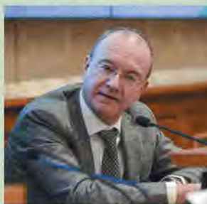
Il ministro dell'Istruzione Giuseppe Valditara

d'Oriente; La codificazione di Giustiano e le radici della civiltà giuridica moderna; L'espansione islamica). "Entro l'avvio dell'anno scolastico 2026/2027, le istituzioni scolastiche