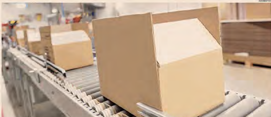
La sospensione. Il rinvio fino al 30 giugno del contributo di due euro sui mini pacchi extra Ue arriverà con un decreto legge in uno dei prossimi Cdm