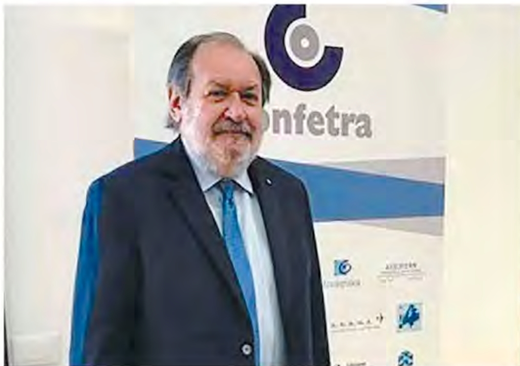
Presidente Guido Nicolini è a capo della Confederazione generale italiana dei trasporti e della logistica