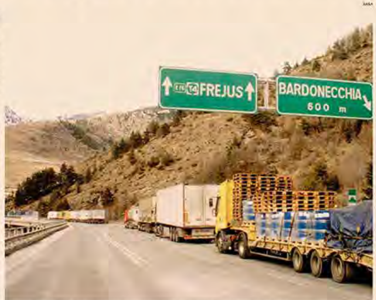
Collegamenti a Nord-Ovest. Allarme degli autotrasportatori sui costi dei trafori sotto le Alpi

Il concessionario italiano del tunnel del Frejus è SitaF. La società, controllata con il 66% da Astm (gruppo Gavio) e partecipata con il 34,74% da Anas, gestisce traforo e A32 Torino-Bardonecchia per un totale di 94 chilometri. La concessione prevede una durata fino al 2050, come stabilito da convenzione Italia-Francia. SitaF ha chiuso l'esercizio 2019 con un utile netto di 32,8 milioni. Spiega Rossi: «I pedaggi da traforo assommano a 180 milioni, che vengono divisi in parti uguali da SitaF e