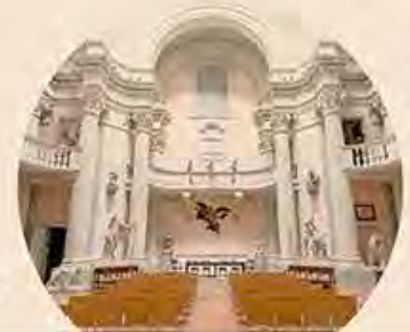
Accademia. La storica sede delle Belle arti di Bologna