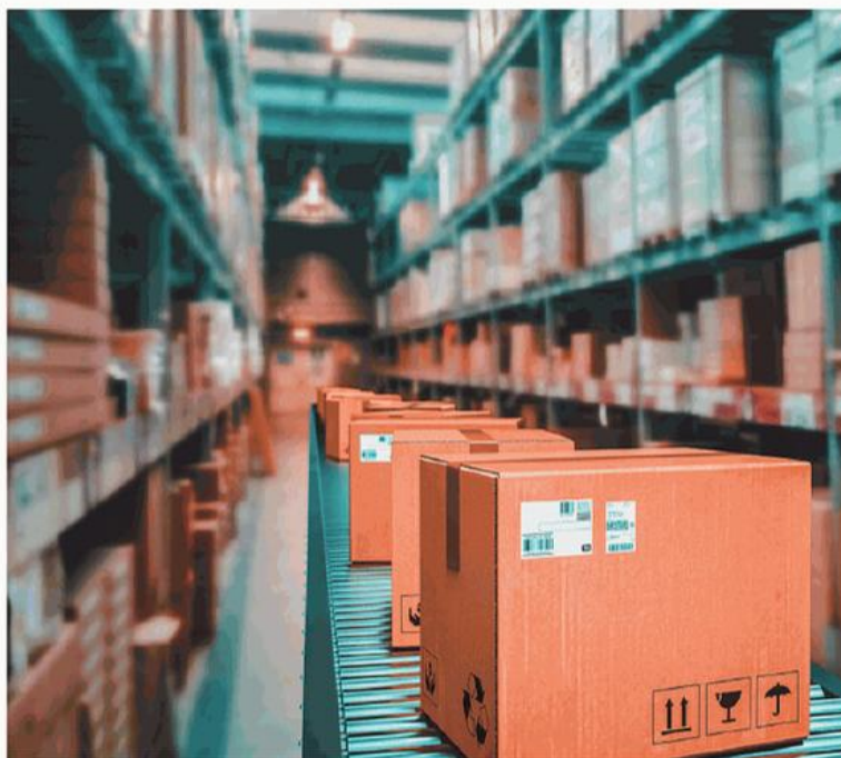
L'interno di un centro di smistamento di pacchi

Intanto il decreto Piano casa incassa la fiducia alla Camera seppur tra le polemiche: a sollevarle è la nomina del commissario straordinario per l'edilizia popolare, arrivata prima ancora dell'ok dell'Aula. Si tira invece un sospiro di sollievo per il