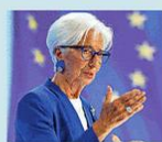
Christine Lagarde (Bce)

L'analisi della presidente parte da un mutamento strutturale tangibile. I tassi si sono allontanati dal limite inferiore, spinti da dinamiche come la spesa per la difesa. Gli shock attuali colpiscono l'offerta e plasmano l'economia reale. «Affrontiamo un ambiente geopolitico carico in cui la frequenza dei grandi shock sembra essere in aumento», avverte Lagarde. Materie prime e mercati di ventano anni di pressione, ma a fronte di questa volatilità l'Europa ha mostrato una resilienza capace di contenere le fiammate inflattive. «Non abbiamo più bisogno di ricorrere a strumenti non convenzionali», rimarca la banchiera centrale davanti al neo presidente della Federal Reserve, Kevin Warsh, e i suoi colleghi. Quello che è