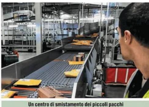
Un centro di smistamento dei piccoli pacchi

Non quindi un dietrofront totale (come chiesto dagli operatori della logistica che lamentano un dimezzamento dei traffici nei primi due mesi del 2026 in cui il contributo di 2 euro sui pacchi sotto i 150 euro è rimasto formalmente in vigore), con un'abrogazione tout court della norma della legge di bilancio che ha istituito la tassa, ma una nuova proroga in attesa che entri in vigore l'handling fee, la tassa di gestione unionale concepita dall'Ue per coprire i crescenti costi amministrativi e doganali legati allo sdoganamento delle merci di piccolo valore. I dettagli esatti di questa tassa sono ancora oggetto di negoziazione tra il Consiglio Europeo e il Parlamento, così come la sua quantificazione che dovrebbe aggirarsi tra i 2 e i 4 eu-