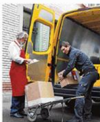
La consegna di un pacco

La stessa richiesta è arrivata da Confcommercio, che appoggia il dazio europeo, «una misura concreta per mitigare la concorrenza sleale e tutelare le mi-