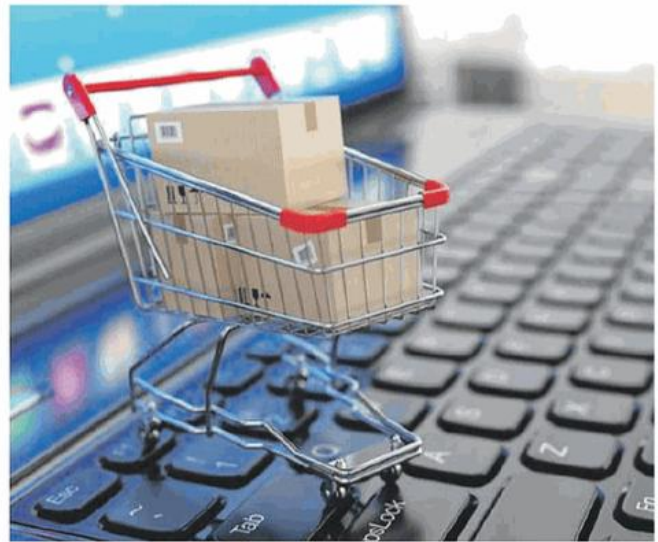
Spesa on line e gli acquisti finiscono nel carrello virtuale ma poi c'è chi li confeziona, trasporta e consegna

Le simulazioni di Confetra mostrano che se l'Italia cancellasse la tassa nazionale e restasse solo